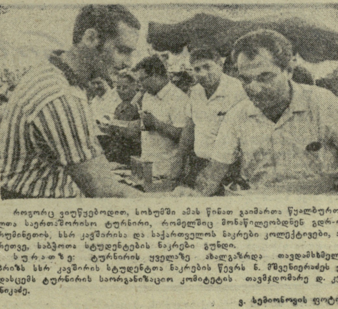
როგორც ვიღწევბოდიო, სოხუში ამის წინათ გაიძარა წყალბურთულთა საერთაშორისო ტურნირი, რომელშიც მონაწილეობდნენ გერმანიის, სსრ კავშირისა და საქართველოს ნაერები კოლექტივები, აგრეთვე, საბჭოთა სტუდენტების ნაერები გუნდი.

1960 წლის ოლიმპიადის (ლიანცი) სსრ კავშირის გუნდმა თავისებური რეკორდი დამყარა — ყველა მატჩი მოიგო.