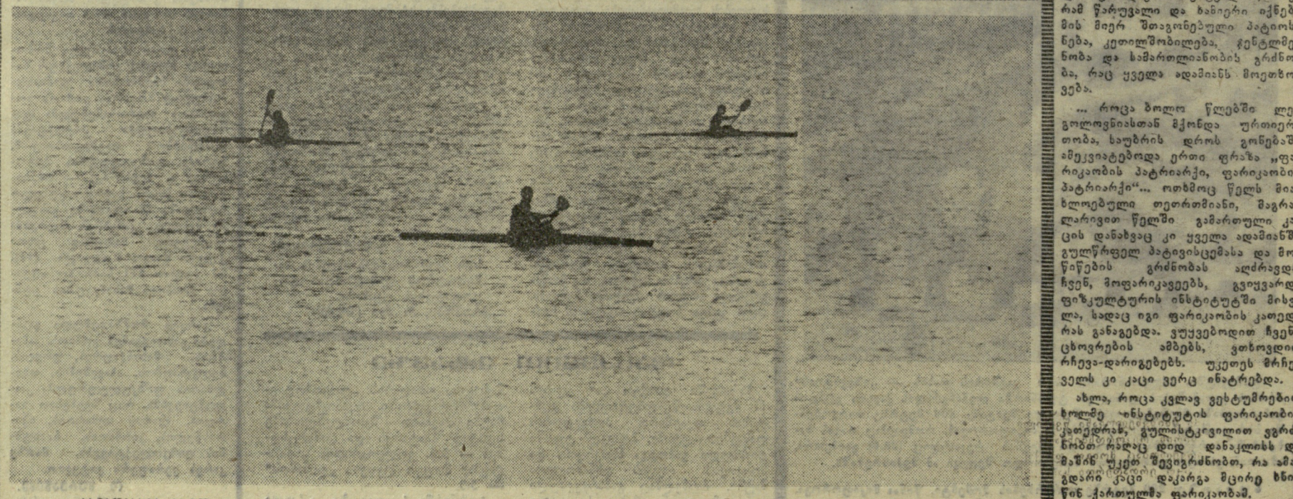
სხვადასხვა ზნით. 8. თათარშვილის ფოტოეტიუდი. 9. გოგალინი, სპორტის ოსტატი.

ლევ გოლოვნიას საშუალოდ და-მიანს. ამ წიგნების უმრავლესობას მრავალი თაობის ხელში გამოველო და მათ წინა ეპოქების დამახასია-თებელი ხურნელი დაპკრავდა. როცა ხახილიან პირველი წიგნი გამოქმნა — მახსოვს, ეს იყო ჭეკ ლონდონის „თეთრი ეშვი“ — თხუთმეტი-თექვსმეტი წლისა ვიყა-ვი. რამდენიმე დღის შემდეგ წი-გნი პატრონს დაუბრუნე. ლევ გოლოვნიამ იგი მაშინვე არ შეინახა თაროზე, ხელში შეათამაშა, გადა-ფურცლდა და ძალიან ტაქტიანად მთხოვა რომელიღაც ნაწილი შემე-