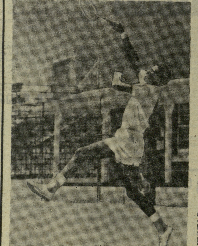
სურათზე: ა. ეში.

ამერიკის შეერთებული შტატების უძლიერესმა ჩოგბურთელმა, ზანგმა არტურ ეშმა დიდი ხანია მიიქცია მსოფლიო პრესის ყურადღება რასიზმის წინააღმდეგ მიმართული საქმიანობითა და შეხედულებებით. აი, ამერიკელი ჩემპიონის ბოლო გამოცხადება: „მე თანდათან მივხვდი იმ შეგნებამდე, რომ ჩემი რასის ხალხში მწიფდება სოციალური რევოლუცია. ეს განსაკუთრებით ეტყობათ ჩემი თაობის წარმომადგენლებს. მე მუდამ ვაცხადებ, რომ ზანგი ვარ, მთელი მსოფლიოს ხალხმა იცის, როგორ დგას ამერიკის შეერთებულ შტატებში რასობრივი პრობლემა. აქ ზანგებს, როგორც წესი, არა აქვთ კარგი სამუშაოს შოვნისა და რივიან ბინებში ცხოვრების საშუალება. მე ვოცნებობ, რომ გამოვადგე ჩემს მოპოლიურ ხალხს და ამიტომ შევედი ლიგა-