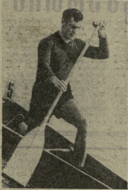
ფოტოში, მდინარე რიონზე ნიჩოსნობის ახალი ბაზის აგებანთან დაკავშირებით, გაიმართა საკავშირო პირადი ტურნირი ზაიდარბითა და კანოებით ასპარეზობაში. სურათზე: ერთად-გლიანი კანოებით შეიბრებარა ასალგარდების დასაკეთებელი მოჭადრაკეები, რაგონიანი-ნა, მ. პოლუგავენი და ვ. ტუმაკოვი, არ არის გამთრეული, რომ უფრო-თი მათგანი სატურნირო ცნობის ყველაზე მაღალ საფეხურზე მოხვდეს. ჯერჯერობით მხოლოდ ერთი რამ შეიძლება ვერჩიო ასალგარდა მოჭადრაკეებს: რაც შეიძლება სწრაფად ითამაშონ ძლიერ მეტოქეებთან. სოჭში ჩატარებული ასპარეზობის შედეგად ტურნირები ტრადიციულად უნდა იქცეს. დიდოსტატებთან შემოქმედებით ურთობას უდიდესი სარგებლობის მოტანა შეუძლია.

წესულ მოეწყო გადაღებული პარტიების დამთავრება.