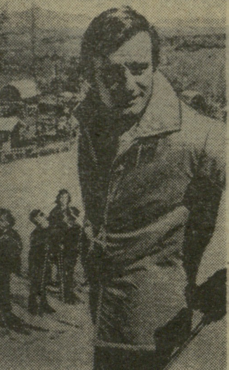
შ. პ. კილი.

რაობა. იგი შეტანილი იყო ჯერ კიდევ ლონდონის IV ოლიმპიადის პროგრამაში. გათამაშდა ოქროს, ვერცხლისა და ბრინჯაოს მედალების 4 კომპლექტი ვაჭთა საჯარო-დებულო ვარჯიშებში და ნებისმიერ ციკლიზაციაში, ქალთა საჯარო-დებულო ვარჯიშებში და წყვილთა სრიალში. ვაჭთა საჯარო-დებულო ვარჯიშები მიიღო უ. ციხორია (შვეიცია), ნებისმიერი ციკლიზაცია — რუსეთის წარმომადგენელმა ნ. კოლომენკინმა (მისი სპორტული ფსევდონიმი პანინი იყო), ქალთა საჯარო-დებულო ვარჯიშები — მ. საიერსმა (დიდი ბრიტანეთი). წყვილთა სრიალი კი გერმანულმა დუეტმა — ა. ჰიუბლერმა და ვ. იურგერმა.