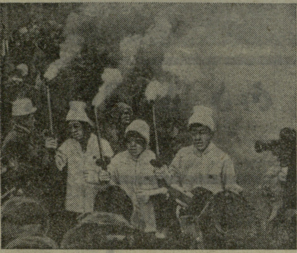
ოლიმპიადის კანონიერება მინიჭდა. დასასრულს ბრენდერმა თქვა: „სართავში ოლიმპიურ კომიტეტს არაფერს დისკვალიფიკაცია არ სურს, თვითონ სპორტსმენები არღვევენ წესებს და ამით საკუთარ თავს უკლებენ დისკვალიფიკაციას.“

როგორც წინა ნომერში ვიტყობინებოდი, 29 იანვარს საბჭოთა ოლიმპიური ჩირაღდანი ჩაიტანეს. ამ სურათზე თქვენ ხედავთ იპონელი სპორტსმენებს, რომლებიც ოლიმპიური ჩირაღდნებით არიან ზამთრის XI „თეთრი თამაშების“ დედაქალაქის ერთ-ერთ ქუჩაში.