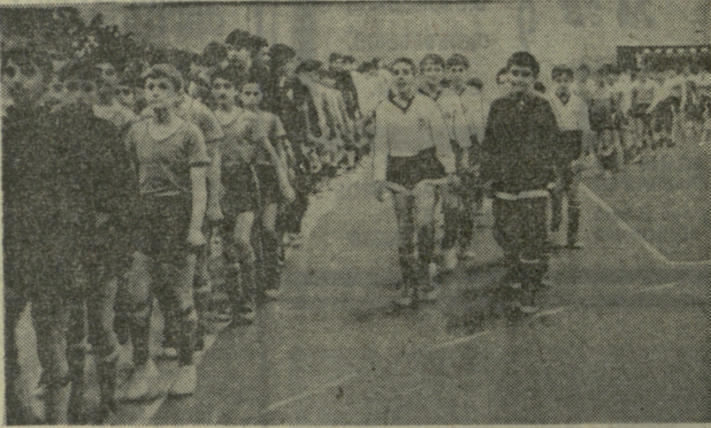
თბილისის სპორტის სახსლში დაიწყო ნორჩ ფეხბურთელთა ტრადიციული პრიზის გათამაშება. სურათზე: ასპარეზობის მონაწილენი შეჯიბრების გახსნის აღმსრულებელი თამაშის მომენტები.