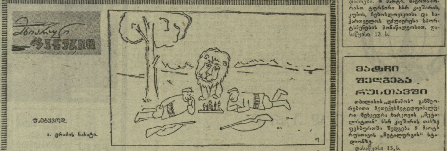
სტიტპოვო. ა. ვრამის ნახატი.

რომულამ 1000 მ 1 წუთსა და 42,6 წამში გაიბრნა.