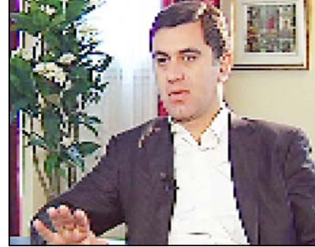
რა კავშირი აქვს ამ საქმესთან ირაკლი ალასანიას

ვანტანბ აპ.2 ქაბირაძე: კონსტიტუციაში ბევრი რამ არის გასასწორებელი“