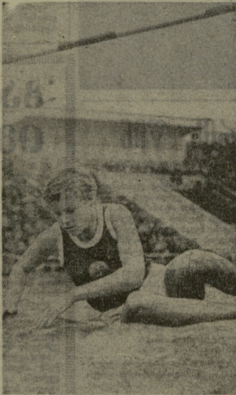
ბ. ზვიდნი.