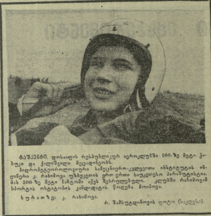
ბაშაძენი დოსაფის რესპუბლიკური აეროკლუბში 100-ზე მეტი კაბუცი და ქალიშვილი მეცადინეობს.