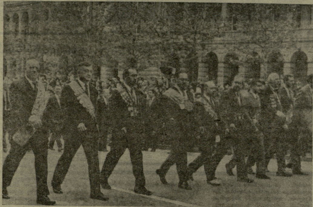
სურათზე: ვიტრან სპორტმენტა კოლონა სამაისო დემონსტრაციაზე.

მაისი კომუნალიზაციის საბჭოთა გეგმითი სიტყვის დღეა!