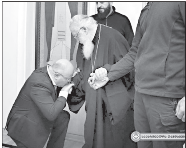
მეორე ნახევარში, შეისწავლიან საღვთო სჯულს, ქართულ ენასა და ლიტურატიურას, ისტორიასა და ხელობას, მშენებლობას ან საოჯახო საქმიანობას. ეს ძალიან საჭიროა. ადამიანი ჯარიდან რომ წავა, მან უნდა შეინახოს თავისი ოჯახი, – განაცხადა უწმიდესმა.

– ჩვენ გვმზადდებით სინოდის სხდომისთვის, სადაც ერთ-ერთი საკითხი იქნება საკვირაო სკოლები, კვირასა და კვირის სხვა დღეებში, დღის