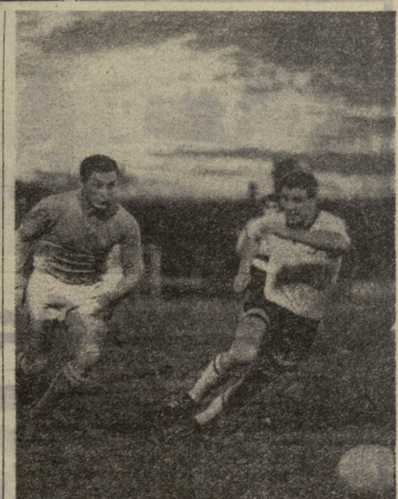
ბათუმი ცენტრი, ქართული სპორტული საზოგადოება...