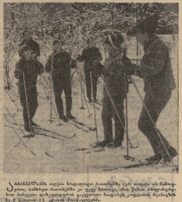
ბასკეთის სპორტმწოდებლები ბასკეთის სპორტმწოდებლები