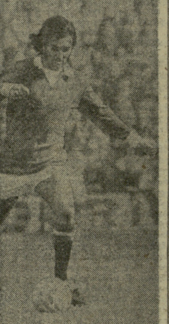
სურათზე: გ. ბესტი თამაშის დროს.

„მანჩესტერი იუნაიტედი“ და ჩრდილოეთ ირლანდიის ნაკრები გუნდის სახელგანთქმული თავდასხმეული ჯორჯ ბესტი ახალი დიდების წინაშე დგას... — მე აღარ ვარ ფეხბურთელი. კინოხელოვნებაში უნდა ვცადო ბედი. სპორტს ვეთხოვები, — ასე განაცხადა ბესტმა 21 მაისს. ეს განცხადება გამოქვეყნდა პრესაში, რადიოში, ტელევიზიაში... ბესტის ამ მოულოდნელმა გადაწყვეტილებამ დიდი მითქმა-მოთქმა გამოიწვია. დიდი ბრიტანეთის ცნობილი მწვრთნელები, სპეციალისტები, უფრანალიტები გაოცებულნი გამოიყვამდნენ. მათი ერთი ნაწილი კი ირონიულად შენიშნავდა, რომ საეჭვოა ბესტმა კინოხელოვნებაში ისეთ მწვერვალებს მიაღწიოს, როგორსაც მწვანე მინდვრებზე... ვითორებთ: ყოველგვამ ეს მოხდა მაისში, ახლა კი ივნისია. და აი, ამ რამდენიმე დღის წინ ბესტმა განაცხადა, რომ მომავალ სეზონში თამაშს აპირებს (არა კინოფილმში, არამედ საფეხბურთო მინდვრებზე). ამ განცხადებამ სპეციალური კომისია განაჩილა, რომელიც გადაწყვეტს რა ზომები მიიღოს ბესტის მიმართ კონტრაქტის დარღვევისთვის.