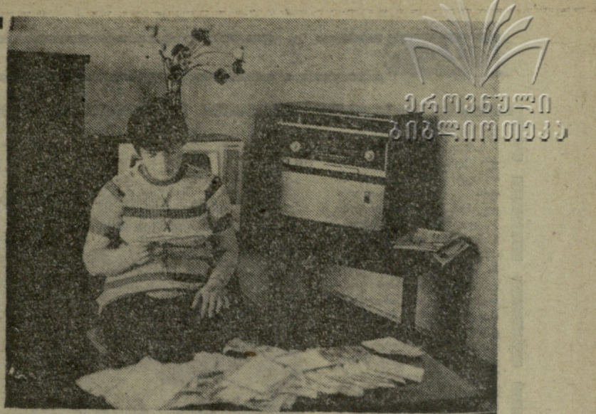
სურათზე: თავისუფალ დროს მსოფლიო ჩემპიონი ნ. გაფრინდა-შვილი კორესპონდენტს ათვალთვრებს.

როსიანს ქონდაო. ფლორმა თქვა: სპასი თუ კარგ ფორმაში იქნა, ფიგური მას ვერაფერს დააკლესო. ამასთან დასძინა, რომ სპასიკმ მოკლი ძალით ვერ ითამაშა ალიოსინის მიორალში კარგია, თუ ეს მხოლოდ ვარჯიში იყო, როგორც ფსიქოლოგი ამბობენ. ზეიმის დასასრულს გაიმართა ერთდროული თამაშის სუანსი 100 დაფაზე, რომელიც ტალმა, ფლორმა, გიპსლისმა და ლენინგრადელმა ოსტატმა ა. კორელთვმა ჩაატარეს. სუანსში გამარჯვებულს ჯილდოდ გადაეცა ფინერის წიგნი „ჩემი 60 პარტია“, რომელიც ახლახან რუსულ ენაზე გამოიცა. ზეიმის შემოსავალი მშვიდობის ვონდში ჩაირიცხა.