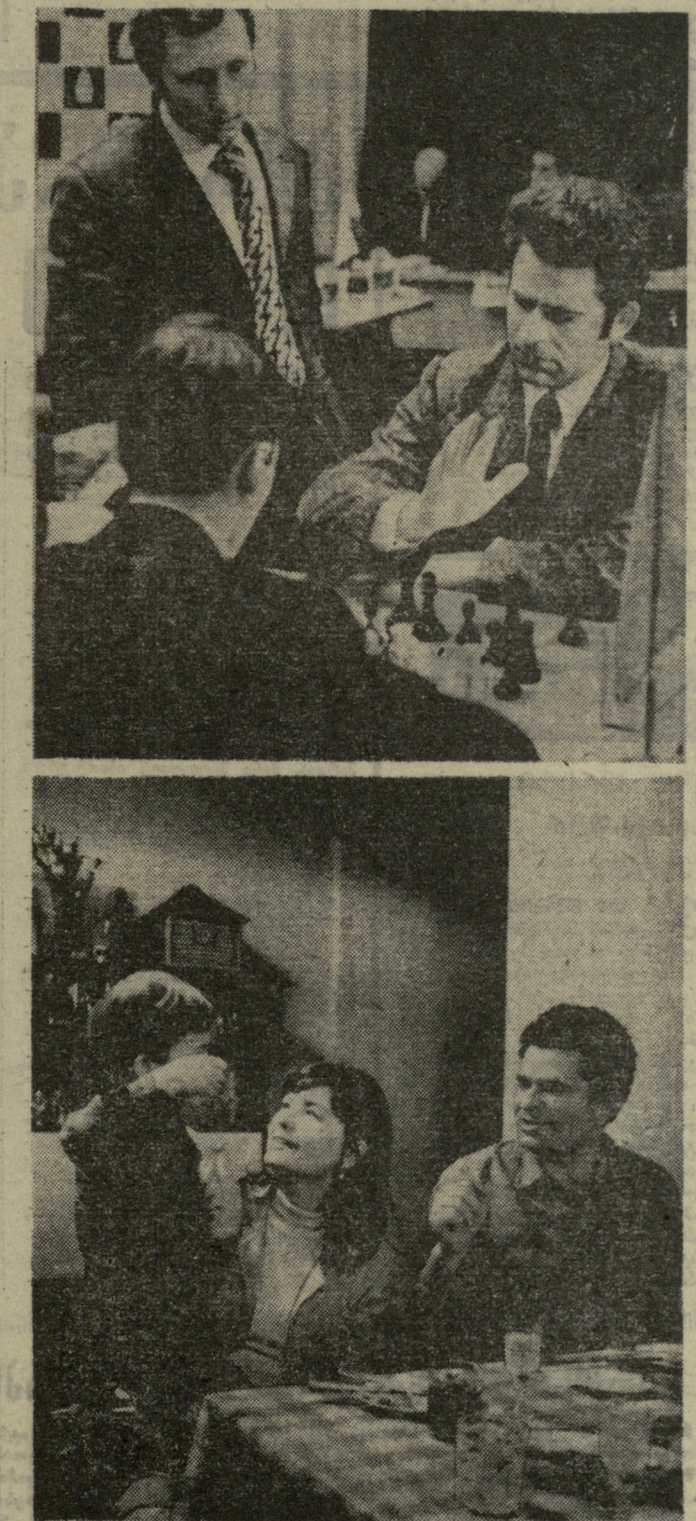
ა. ალიონის ხსოვნად. მიღწილი დიდი საერთაშორისო ტურნირი იყო ბ. სპასკის ბოლო შეჯიბრება, სადაც მან რ. ფიშერთან მატჩის წინ ითამაშა. ზედაპირითი სწორედ ამ ტურნირის დროსაა გადაღებული ეს-ესაა მსოფლიო ჩემპიონმა დამთავრა შეხვედრა ახალგაზრდა დილისტატ ა. კარპოვთან (ზურგიტ ზის). პარტია ყაიმით დასრულდა, მაგრამ იმდენად საინტერესო იყო, რომ მეტოქენი ისევ დაუბრუნდნენ მას. — არჩევენი, ანალიზებენ. ჭადრაკის გამო მსოფლიო ჩემპიონს თავისი ოჯახი არასოდეს დაეწვებია. მუდულდ ლარისა და წლის კასია (მათკვედა სურათზე ხედავთ). აგრეთვე, უფროსი გოგონა ტანია სპასკის ნამდვილი მეგობრები არიან. ეს ძალიან ამხნევეს მან მძიმე საქადრაკო ბრძოლების დროს.