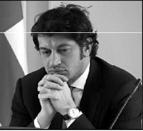
წვენი დავაფიქსირებო მთბო და ერთობა, ერთი საერთო მონაწილეობის შედეგად...

სისხლის დაცემის დღისთან დაკავშირებით ვეფაა ვართ. ვინც ვართ. ვინც ვართ.