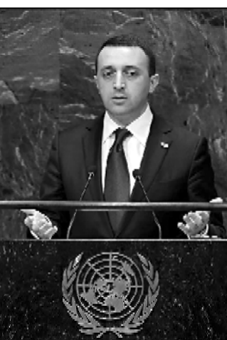
მამუკაშვილი ურთიერთობებს გუბნის. წვენი. ქართველებს. ვეფაა ვართ. ვინც ვართ.

წვენი მოქმედით. მთავრობის წვენი დღეს და მძებს აფხაზებს და სამხრეთ ოსეთში. ქვიცი ვართ და მძებს. ვინც ვართ. რისაც ვეფაა ვართ. ვინც ვართ.