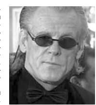
его статус знаменитости.

зывались такие звезды, как Билли Дюкэл и Дайана Росс, 14 сентября, вскоре после очень неприятного для него инцидента, происшедшего в городке Малибу, расположенном рядом с Лос-Анджелесом на берегу Тихого океана. Нолт долгие годы страдал пристрастием к алкоголю, однако несколько лет назад объявил, что отказался от спиртного и табака и стал сторонником здорового образа жизни. Он активно пропагандировал использование витаминов. Положительному образу актера всегда мешали известное пристрастие к алкоголю и любовные похождения. После съемок в боевике «48 часов» (1982) Ник Нолт занял прочное место звезды Голливуда. Последующие роли в «Вопросах и ответах» (1990) Сидни Лумета, в «Мысе страха» (1991) Мартина Скорсезе, в «Принце приливов» (1991) и в «Масле Лоренцо» (1992) были очень удачными и утвердили