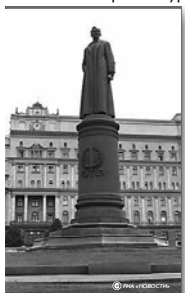
Памятник Феликсу Дзержинскому на Лубянской площади

лем темных сил выступил депутат от партии «Союз правых сил» (СПС) Ирина Хакамада, которая заявила: «Никакие аргументы о том, что памятник восстановит архитектуру».