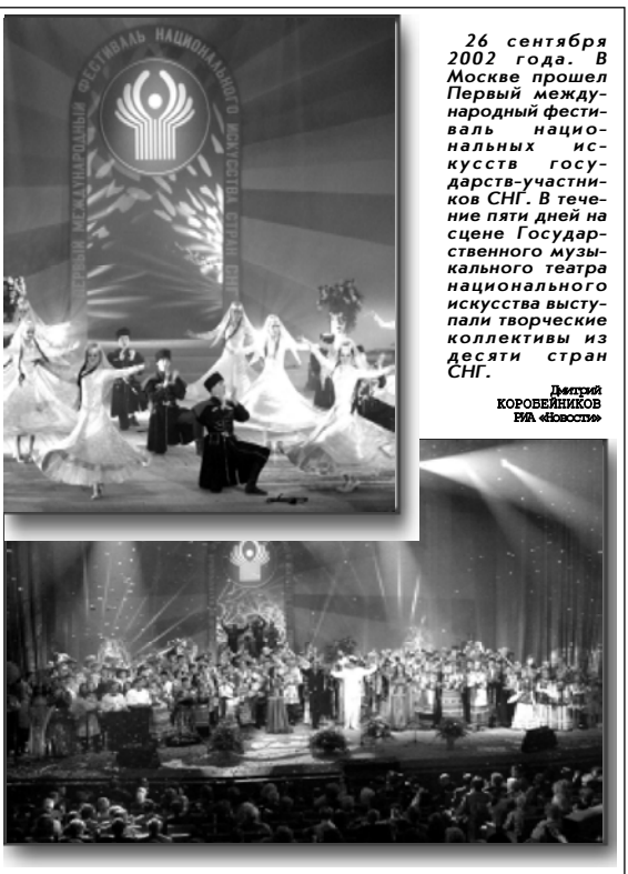
Дмитрий КОРОВЕЙНИКОВ, РИА «Новости»