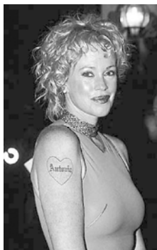
Мелани Гриффит, жена Антонио Бандера