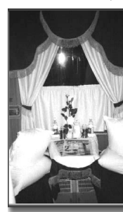
Елена ТИМОФЕЕВА, РИА «Новости»

Салоны выполнены из светлого негорючего стеклопластика и оснащены новейшими системами освещения, отопления, водоснабжения, вентиляции, сигнализации и пожаротушения.