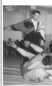
Около 60 атлетов из различных вузов спорта Грузии (председатель правления

лицы выступили в турнире по вольной борьбе, посвященном 50-летию участия грузинских спортсменов в Олимпийских играх. Он был организован спортивным клубом Академии физического воспитания и спорта,