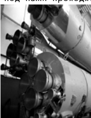
МКС с пониманием относятся к процедуре заполнения российскими космонавтами переписных листов. «Перепись эта очень важ-

листы заполняем как граждане России, а под нами проходят