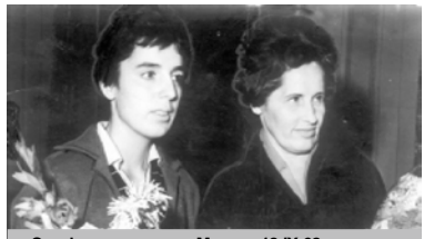
Это фото сделано в Москве 18. IX. 62г. в день открытия матча Ноны Гаприндашвили (слева) и Елизаветы Быковой

Утро 17 октября в Москве выдалось солнечным, но прохладным. Спустились в вестибюль гостиницы «Москва».