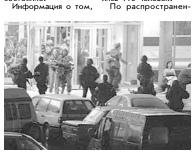
Во время штурма здания ДК на улице Мельникова в Москве.

Перед группой стояла задача. Первая - контролировать настроение заложников, тайно информировать Бараева о возможных попытках пленников вырваться на свободу, а также провоцировать их. Вторая - страховать женщин-смертниц, которые должны были в случае штурма взорвать здание, от всякого рода непредвиденных поворотов событий.