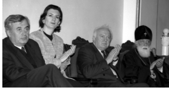
Месхи, Меджик Джонсона и др.