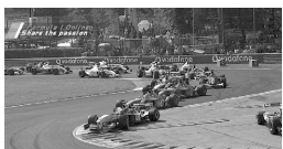
«Больших призов» был принят ряд кардинальных изменений в

На совещании FIA's Formula One Commission в Лондоне (в нем принимали участие президент FIA Макс Мосли, вице-президент Берн и Эклстоун, представители всех команд, основных спонсоров, мотористов, шинников и других финансовых партнеров