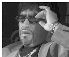
Но на этот раз у него под рукой просто не