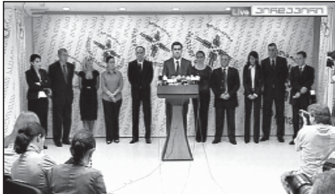
№ 185. ოქტომბერი. 26 სექტემბერი. 2007 წელი.