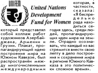
United Nations Development Fund for Women

который представлял собой коллаж работ художников Азербайджана, Армении и Грузии. Плакат, пропагандирующий идею построения мира на Южном Кавказе, был распространён между многостранними международными