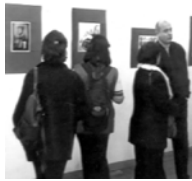
Такой лейтмотив был у прошедшей недавно экспозиции плакатов в Грузинском центре культуры и искусства. Инициаторами своеобразной выставки-акции выступили Фонд развития ООН для женщин (UNIFEM) и Грузинский центр культуры и искусства.

его по праву считается популярная экспозиция искусства, которое является мощной силой в разрешении политических конфликтов. В рамках проекта в прошлом году в трёх странах Южного Кавказа одновременно проводился конкурс социального плаката. Был создан своеобразный календарь,