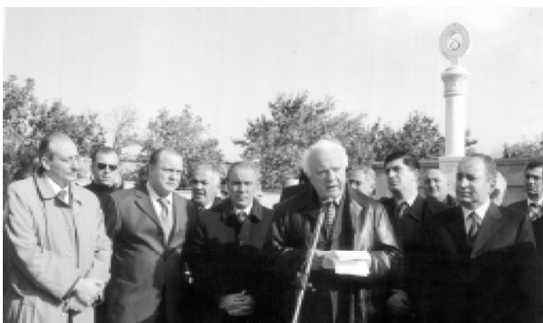
доски были доставлены из Еревана.