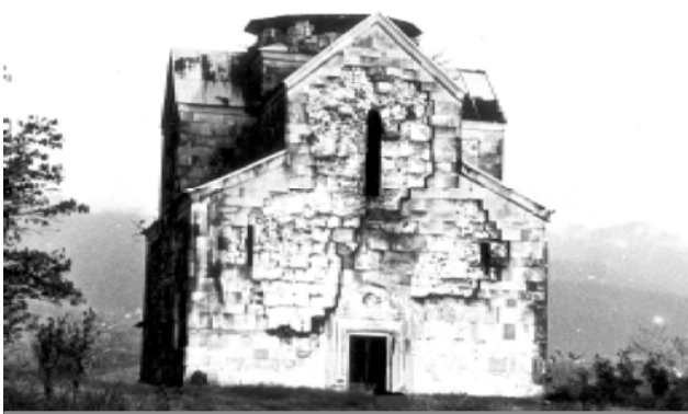
Бедийский храм (совр. Очамчирский район)

средневековое Сухуми и охраняла порт, расположенный тогда у устья