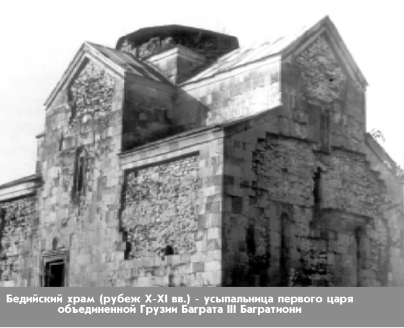
Бедийский храм (рубеж X-XI вв.) - усыпальница первого царя объединенной Грузии Баграта III Багратиони

в XI-XII вв. теперешняя Абхазия не имела никакой автономии. Она даже не была единой в административном отношении. Единственная привилегия, которой, бесспорно, добились абхазы XI-XII вв., была неустанная борьба за дальнейшее укрепление и упрочение военно-политического могущества своего отечества объединенного Грузинского государства. В XI-XII вв. на территории современной Абхазии процветала средневековая грузинская христианская культура. В этом плане данный регион, как верно