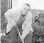
Абхазии вы ведете именно осенью!

- Почему съемки в Абхазии вы ведете именно осенью? - Мы приехали в большей степени понаблюдать и снять местное население во время сбора урожая. Понятно, что Абхазия сейчас живет за счет вывоза фруктов в Россию. Мы снимаем весь абхазов: как готовят сыр, мамалыгу, вино, как собирают виноград, кукурузу. Я думаю, что курортная инфраструктура Абхазии очень долго не будет такой, как, например, в Турции. Люди вряд ли сюда поедут просто позарядить на пляже, это можно сделать и в других местах. Здесь много привлекательных вещей для этнотуризма. В Европе - во Франции, Испании - много богатых людей, которые живут в городах, но готовы платить деньги за то, чтобы пожить на фермах, «побратиться», принять участие в сборе урожая, сыроварении и пр. В Абхазии делают вино так, как это делали, может быть, в античные времена. Сегодня редко где увидишь, когда виноградная лоза обвивает деревья. Здесь же можно увидеть все в первозданном виде. Вряд ли где-нибудь есть место, где на одном побережье столько дач Сталина, причем сохранившихся в неизменном виде. Мы это тоже снимали. Стоит ли заниматься каким-либо глобализ-