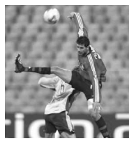
Мюнхенская «Бавария» так и не сумела

Осер (Франция), Ливерпуль (Англия), АЕК (Афины, Греция), Лион (Франция), Динамо (Киев, Украина), Маккаби (Хайфа, Израиль), Ланс (Франция), Брюгге (Бельгия).