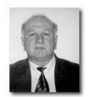
ликта в Абхазии!

Одним из самых ярких сторонников радикального пути является председатель Верховного Совета Абхазии Тамаз Надарешвили. Как вы оцениваете его слова, что он будет противостоять «экономическому пути» решения этой проблемы?