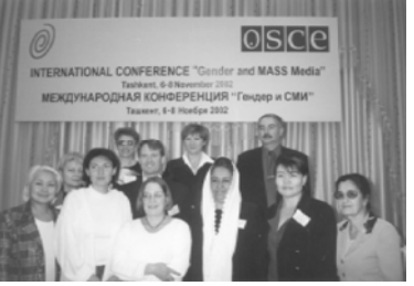
Международная конференция "Гендер и СМИ" в Ташкенте, 6-8 ноября 2002 года.

Так называлась международная конференция, которая недавно прошла в Ташкенте. В ней принимала участие и наш корреспондент