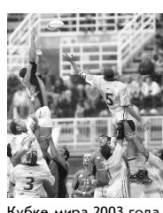
Кубке мира 2003 года. Каждая федерация, прошедшая отбор на это соревнование, по-

В Дублине завершился ежегодный совет IRB (Международная федерация регби). Было принято решение отказать в проведении Кубка мира 2007 года основным претендентам Англии и Франции, из-за того, что они не предоставили удовлетворительных схем проведения этого турнира.