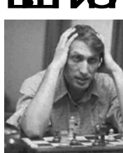
Сенсационную информацию опубликовало агентство AP. Оказывается, ФБР долгое время подготавливало чемпионку