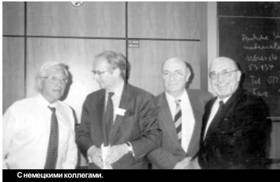
С немецкими коллегами.

не привлекают меня, несмотря на то, что они сулили мне и моей семье более обеспеченное материальное положение и лучшие условия жизни. Быть чиновником мне не по душе, так как я не смог бы сохранить даже ту относительную свободу и независимость, без которой не представляю свою жизнь. За все годы моей трудовой деятельности у меня не было непосредственного начальника, которому я должен был подчиняться и который имел бы право "наказать" меня. В связи с этим мне вспоминаются слова, сказанные, как