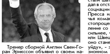
Тренер сборной Англии Свен-Горан Эрикссон объявил о своем на-

разочарование результатом встречи с «Севильей», подчеркивая, его команда «должна была выигрывать, но проиграла».