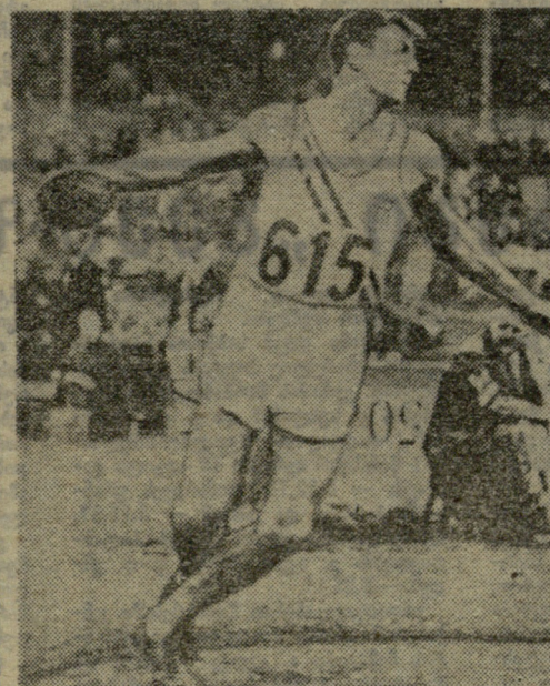
სურათები: XIV ოლიმპიადის საუკეთესო სპორტსმენები რ. მათიასი და ფ. ბლანკეს-კოენი.