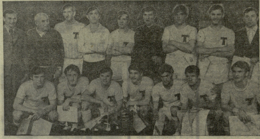
სურათზე: საბჭოთა კავშირის თასის წლევეანდელ გათამაშებაში გამარჯვებული მოსკოვის „ტორპედო“ გუნდი.