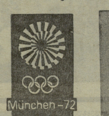
მიუნენი — XX თამაშების დედაქალაქი. ს. სმარნოვის ფოტო („იზვესტია“)

მიუნენი, 28 აგვისტო. კორეის სახალხო-დემოკრატიული რესპუბლიკის წარმომადგენელმა ლი ხო ჯუნმა ყველას აჯობა მცირეკალიბრიანი შაშხანით 50 მეტრზე 60 გას-