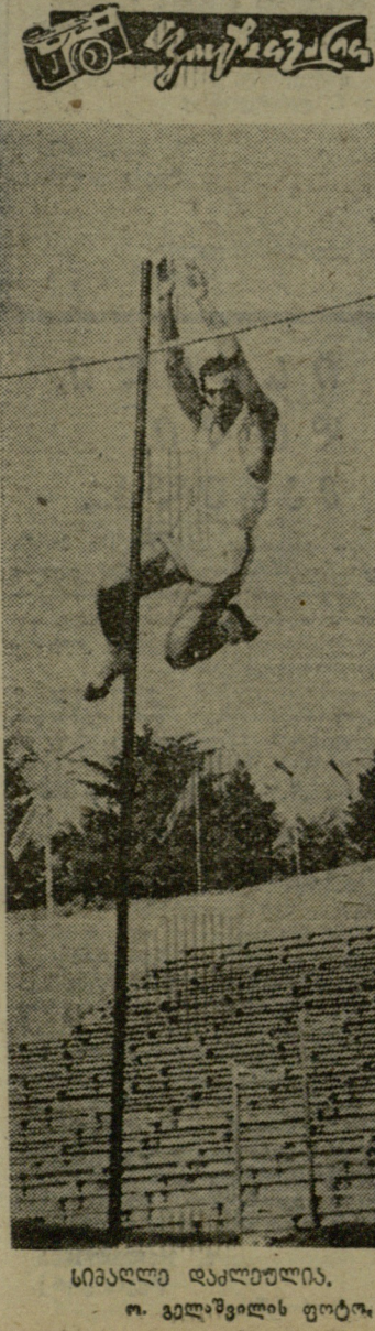
სიმაღლე დააღწა.