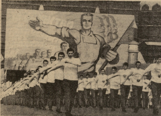
პირველი მინის დღესასწაული მისეში. შვიმიტის წარმომადგენლის დემონსტრაცია. სურათზე: პირველი ახალგაზრდის მარჩხარად წოდებული მინეტი. შუიტი ლ პირველის (საქველს).