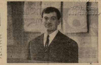
მისი მხარეს, რომელიც...