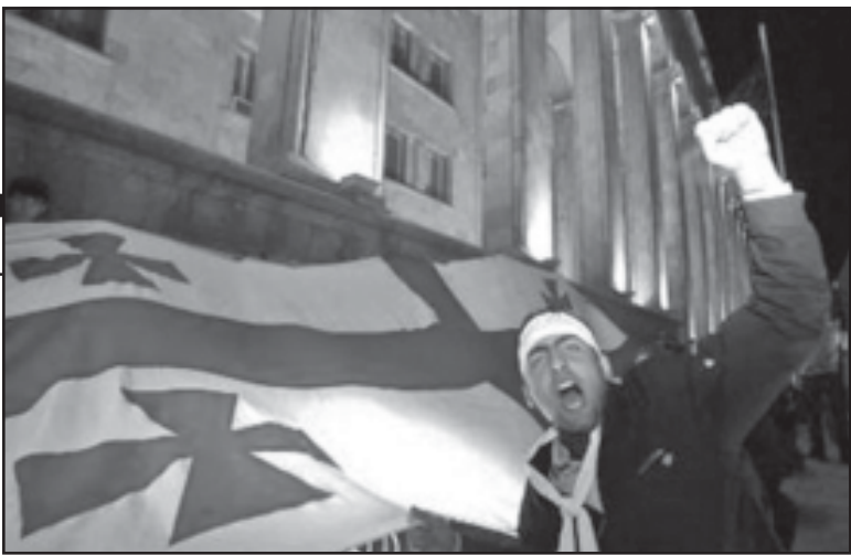
სტრეშობა ღაცვა და მთი მთიარეთ ვალდებულება ჩვენ ბავშვობიკე-ბული უნდა გვქონდეს.

მაშინ, როდესაც საზოგადო საჭმე „ვარდების რევოლუციით“ წყდებოდა, ავტორი და ბავშვებით თუ არა მსოფლიო შიშველ სიტყვას? იმაზე კი, ახამდე ვინ რა ნაშრომადართი იყო მოსული, არც კი გვიფიქრია. არჩევანიც ასევე გააკეთეთ. ამიტომაც და „ქრისტე“ ხომ არ ვინმე მავანთ და მავანთ? ახლა კი გვიკვირს, „ბაღაბაგადესო“?