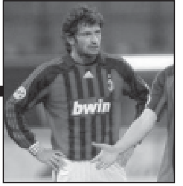
№ 214. ხუთშაბათი. 8 ნოემბერი. 2007 წელი.