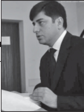
„უღრესესი ის მაქსიმალურად იქნება და მოგვალვნიც გამოიყვანებს.“

რაც შეეხება იმას, თუ ვინ იქნება ყველაზე წარმატებული კანდიდატი ოპოზიციიდან, ამ პირთა წრე საკმაოდ შეზღუდულია. მაქსიმუმ მხოლოდ 4 პირს ეძება ლეზარაქი, თუმცა ეს მინც იმას ეფუძნება, თუ როგორ წარმართავენ ისინი წინასწარჩევნო კამპანიას