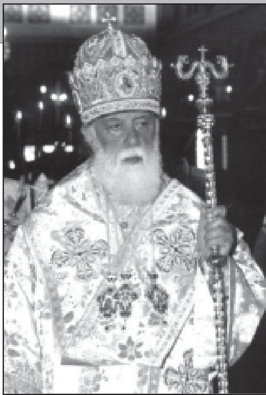
მიმართვა უმბავს – სრულიად საქართველოს სულიერი მამის აღსაყდრების ოცდაშვიდი წლისთავზე

სულიერ რუსთველს, ოვიზარს – მას ვანდოვთ სულის ყისმათს, სწორად რომ სულზე მოგვისწრო ჩვენ აღსაყდრება მისმა.