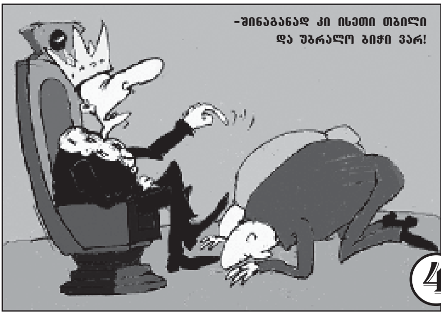
-ზინაბანად კი ისეთი თბილი და უბრალო ბიჭი ვარ!

კებრე თუმც ცდილობს, კავლე დაირქვას, მებრამ სხვა კაცად იქცევა ბანა?