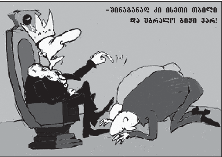
- შინაგანად კი ისეთი თხილი და უბრალო გიჭი ვარ!

- შენოვანს საკუთარი სახსრებით ერთ თვეში გა- ვარამობდებო, ამ დროის განმავლობაში კი გამოსახ- ლებულ დევნილებს საცხოვრებელი ფართსაც ჩვენთვის ფულით დავუბი- რებებოთ, - უთხრა ტელე- შურალისტს ლტოლვილ- თა და განსახლების მიხის- ტრის მოადგილე.