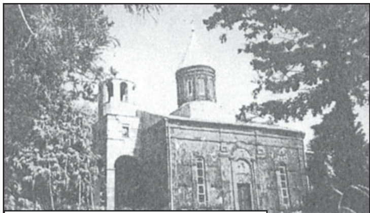
ღვთისმშობლის ტაძრად მიყვანების ტაძარი ჯიხეთში. XIX-XX ს.

აცხადდა ღვთისმშობლის მიხედვით – „ღვთისმშობლის ასული, „ერსა თვისსა“, „სახლსა მამისა თვისისასა“ და მიმავრებაო უფალს საბოთს, რამეთუ „გულგან უთქვას მიუფებსა სიკეთისათვის“ მისისა. ... გზა ფსალმუნთა გლოვით განვლეს, მისამა დღეს იერუსალიმში შევიდნენ, მთელი ქალა-