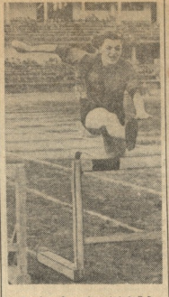
სურათზე იმობლის მონა, 33 მკვიდრისა კ. ილიასძის ვაჟი...