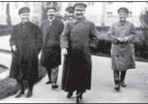
ოსტა სტალინი (მარჯვნივ), მუშაობდა სახელმწიფო მართლის დამცველობაში.

სტალინი - რეპრესიის მისაფლავი ოპოზიციის იტალიკებმა მუშაობა ციხეში დაიწყეს. ზარი სუპარინის ხელით, დასავლეთს ლენინის გამოსახულებით შრომობი, მათს რიცხვი, ლენინის ანდერძად ცნობილი ნაწილიც ჩრილურშია. ამჟამად მათი მუშაობა სახელმწიფო ატყდა