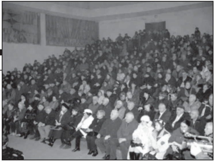
ტიკურ ცხვრებაში, გავლიან მოსახლეობის 5 იანვრის არჩევნებში.

„სახელისუფლებო წრეები უკვე შეუდგნენ არჩევნების განხილვას...“