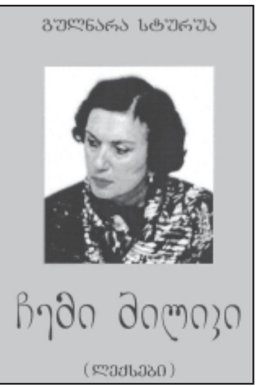
ჩემი მილივი (ლექსები)

ქმნიდა ნახევარი საუკუნის წინათ, ნარდა, ერიდებოდა, მაღაზი, სინამდვილეში მოქალაქეობდა, ხელნაწერებს უკითხავდა ტოლ-მეგობრებს, ნათესავებს; მოწოდების შექმნის შემდეგ ფრთხილად შეასახა ხალხურად ავტორს; ნარდა შინ, გარეთ, თბილისში, საგარეოში, მოსკოვსა და გარდასახვის, ნარდა და მინც ინახავდა, ეხიროდა საკუთარი ნახევარი ლექსებისა, კი არ ეხიროდა, ერიდებოდა, ერიდებოდა მკითხველის შეხებას. ამათგან ლექსი ლექსი ემატებოდა; მგობრად ლექსი და სინათლე ცხოვრების უფლება გარემოში შეცვალა, მგობრად ლექსებს არ დაუპირისპირებია განცდილი უფლებრი და მხატვრული სხვა ნახევარი საუკუნის წინათ დაწერილ ლექსებში განმარტებული უფრო მეტად ურევია, პოეტისადი მუხას რომ უწოდებენ. ამდროინდელ ლექსებში ნათლად ჩანს პოეტის სწრაფვა უკეთესი ხალხისათვის; „ნათი გვალა, რაც იყო გუშინ, თუ გამოიტანდა, არ მთავარა“; „გაზაფხული სივლიანს პოეტს; გუნების გაღვივებას განიცდის სიცოცხლის უფრო მეტად ტკბობის სურვილს.“; „თითქმის დაწერილი“; „გაზაფხული პოეტის გულში იღვამა გრძობა და ანთება; პოეტს სულში ეღვივება სიმღერის გაზაფხულის ფრთები მოტანილი, ეს ის ფრთებია, რომლებიც სიყვარულითა და სიხალსის კიბეებზე აწაფალი ძაღლის ფარის ქალბავს (გაზაფხულია და მინც, პოეტის სუ-