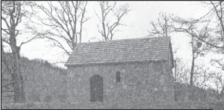
ქვათეთრის ყოველთა ქართველთა წმიდათა მონასტერი