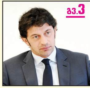
ვინ იქნება „ოცნების“ თბილისის მერობის კანდიდატი