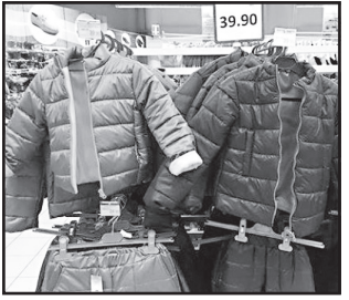
ქურთუებისა და სათხილამურო აღჭურვილობის მწარმოებელი ქართული კომპანია „ატა“ კონკურენციას გაუწევს იმპორტირებული პროდუქციისთვის გეგმავს.

მოებს. ქურთუების საცალო ფასი 39 ლარიდან იწყება.