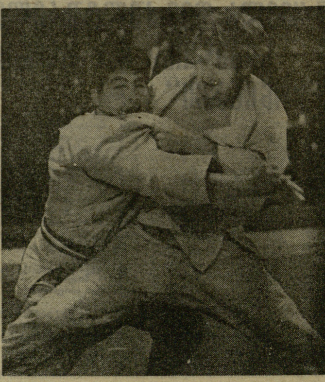
ბ. ზარგარაინის ფოტოები.

მძიმე წონაში ტურნირის მთავარი ჯილდო იაპონელ ზ. უემურსს ერგო. უემურსა საკმაოდ გამოცდილი ძიუდოსტია. საკმარისია ითქვას, რომ ბოლო მსოფლიო ჩემპიონატში მან ვერცხლს