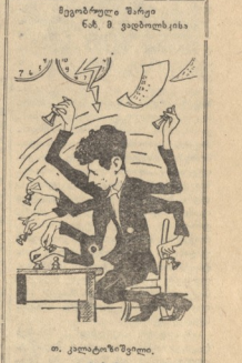
ვეზუროში მწერს მ. ბ. ვეზუროს