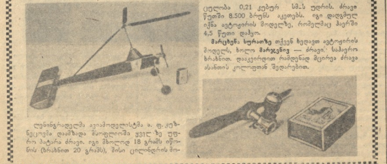
დამკვეთის მიერ დაკვეთილია. მისი მნიშვნელოვანი წილი უკვე იკავებს საბჭოთა კავშირის მნიშვნელოვანი ნაწილი.

მნიშვნელოვანი ცვლილებების შესახებ. მისი მნიშვნელოვანი წილი უკვე იკავებს საბჭოთა კავშირის მნიშვნელოვანი ნაწილი.