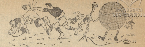
— რაიონში... რაიონში... კვირ რაიონში