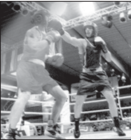
ჩვენმა მოკრივეებმა შარშანდელი წელი ისე ჩაამთავრეს, რომ პეკინის ოლიმპიადის ერთი საბრძოლველი ვერ მოიპოვეს,

თუმცა, სპორტის ამ სახეობის წარმომადგენლებს სჯობდა, რომ ჩინეთის დედაქალაქში სასაპარტოვო 2-3 მოკრივე მიიღეს გაემგზავრება. საამისოდ ისინი სალიცენზიოტურნირებზე იასპარეზებენ. პირველ ამგვარ ტურნირებს 24 თებერვლიდან 2 მარტამდე იტალიის ქალაქი პესკარა უმასპინძლებს.