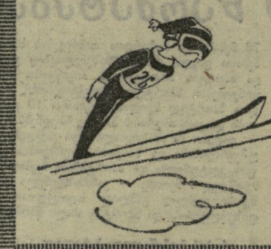
ამობდნენ გავამ და აქი გვიდა კიდევ! გ. იაშვილის ნახატი.

ვიყოთ გულახდილი: მართლაც მოულოდნელი იყო არა მარტო ჩვენთვის, არამედ ყველაწინაინი სიურპრიზების მომლოდინე სპეცილისტებისთვისაც კი მიხეილ გავამ თქროს მისი. ჯერ ერთი, მიხეილმა ასპარეზობა მსოფლიოს ადიარებულ მსტიმელებთან, მორეცე, სპარტაკიდა, როგორც მოგახსენებთ, ყარველ წელს არ იმართება და „შემთხვევით“ არაფერს გავამს გამარჯვების შანსს. ნაპალკოვი, ბელოუსკოვი, კალინი-ნი, წაქაძე, ქველასოვი, ბოროვიტი-ნი, ბოტკოვი, მუსაროვი... ვერაფერს იტყვი, ტყუილბრძანად „სამშობი“ კომპანიაა, რომელშიც აგრეთვე იოლად მსოფლიოს ვერც ერთი სახელგანთქმული ვერ იწავარდებოდა. ამით დამატებით კიდევ შეჯიბრების მონაწილე 58 „თავზე ხელაღებული მფრინავი“ და კიდევ მრავალი სირთულე, რაც ახასიათებს სპორტის ამ ცოტა არ იყოს „ვერავ“ სახეობას. ვისა აქვს გარანტია, რომ თხილამურებით პერში ასული აუცილებლად მშვიდობიანად ჩაუშვებს „ლუსას“, ანდა გამარჯვებს მარტო მონაწილეებთან ჭიდილში კი არა, არამედ პერთან, მზესთან, თოვლთან და კიდევ ვინ მოთვლის რამდენ დაბრკოლებასთან... რაც მთავარია, საკუთარ თავთან, საკუთარ ნერვებთან ულმობელ ბრძოლაში?