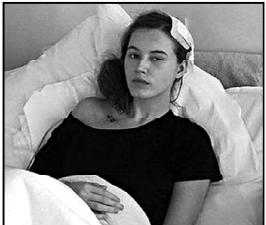
ახალგაზრდა მკვლევარის ახალი ნაშრომი

ახალგაზრდა მკვლევარის ახალი ნაშრომი. მკვლევარის ახალი ნაშრომი. მკვლევარის ახალი ნაშრომი. მკვლევარის ახალი ნაშრომი.