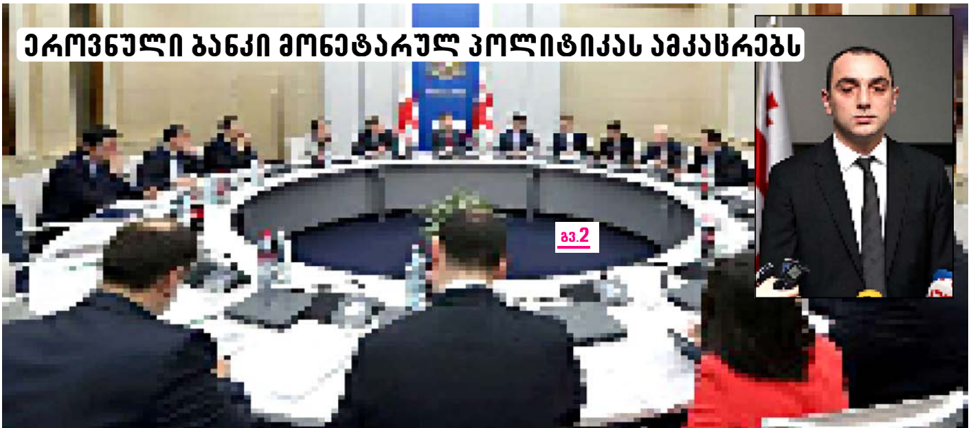
ეროვნული ხანძარი მონეტარულ პოლიტიკას ამაჯანსაღებს

საზოგადოებრივი მითაგრობის შეცდომებს საკუთარ ჯიბეზე იშვს