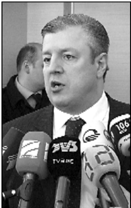
გიორგი კვიციანი, ფინანსთა მინისტრი