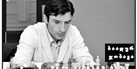
ბილივის მიმდინარე ფიფის გერანი მესამე ეტაპზე მყოფი ტურის პარტიანი გემინა და მსო- ლიერ ერო პარტიანი გემინა...