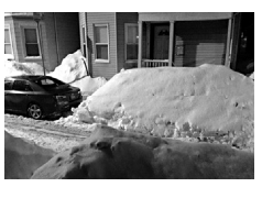
ბოსტონელებს ფანჯრებიდან თოვლი უსტილი